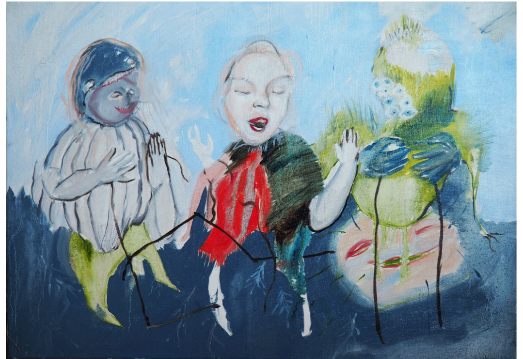
Květiny mysli, 50 x 70 cm, olej na plátně, 2020 Flowers of the mind, 50 x 70 cm, oil on canvas, 2020