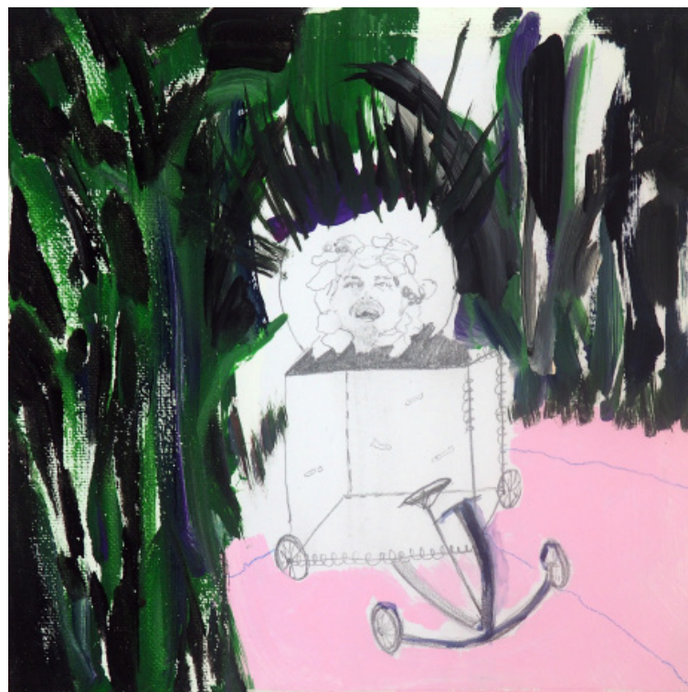
Býti vozem, kombinovaná technika, 20 x 20 cm, 2019 To be a vehicle, mixedmedia, 20 x 20 cm, 2019