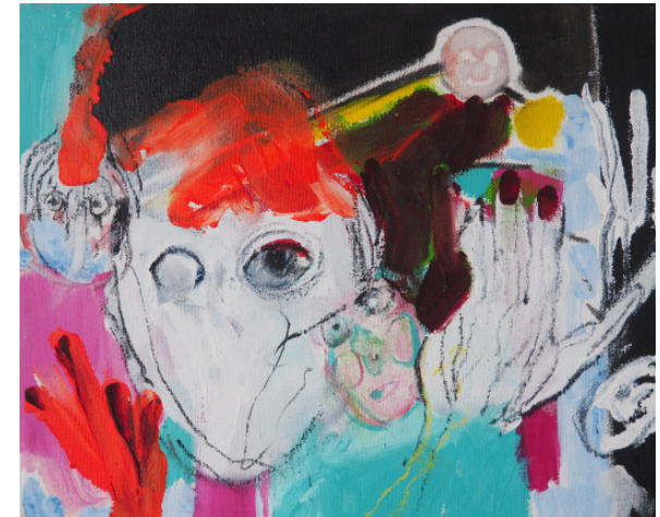
Druh, 25 x 30 cm, kombinovaná technika, 2020 Specimen, 25 x 30 cm, mixed media, 2020