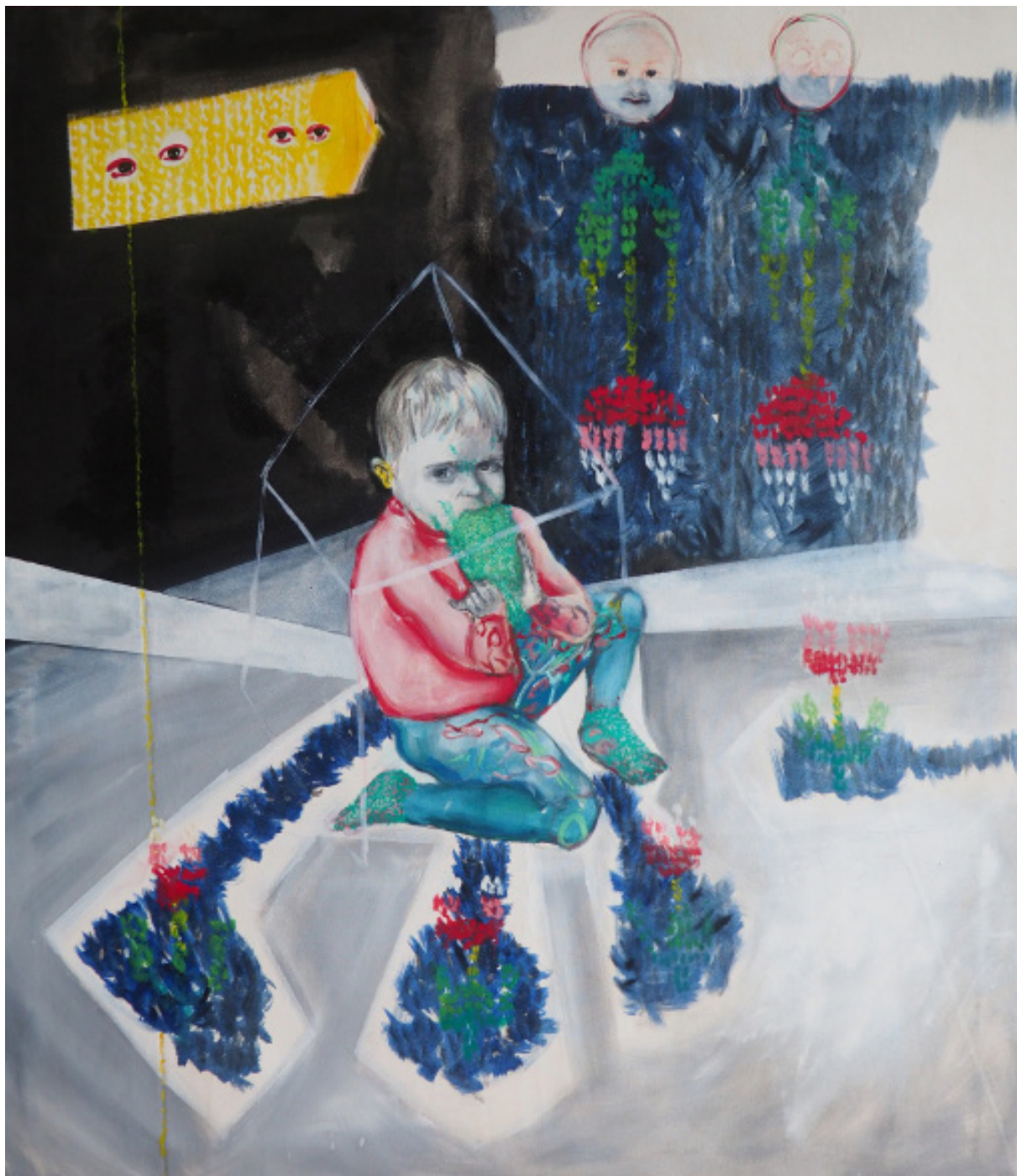
Další pletenina, olejomalba, 115 x 100 cm, 2019 Another knitwear, oil painting, 115 x 100 cm, 2019