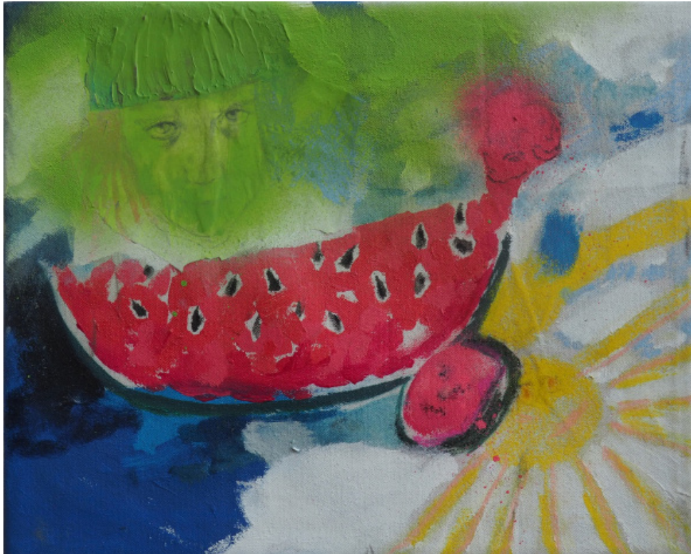
Hlava melounu, kombinovaná technika, 24 x 30 cm, 2020 Watermelon's head, mixed media, 24 x 30 cm, 2020