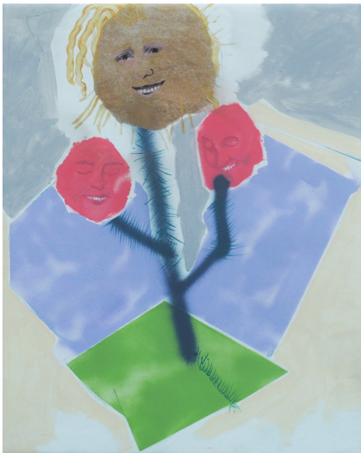
Sluneční muž, kombinovaná technika, 60 x 50 cm, 2020 Sun man, mixed media, 60 x 50 cm, 2020