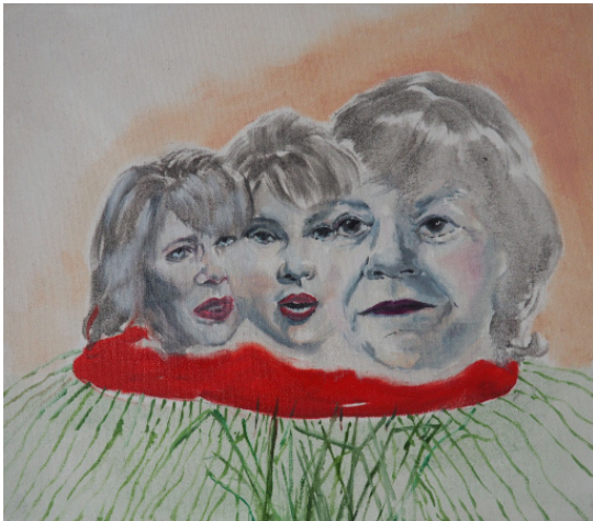
Killing loving, 30 x 35 cm, mixed media, 2020 Killing loving, 30 x 35 cm, mixed media, 2020