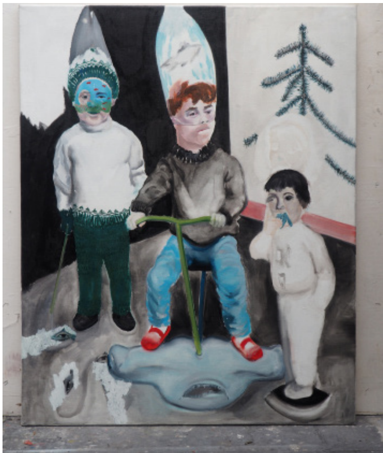
Čas skončit, olejomalba, 110x70 cm, 2019 Time to end, oil, 110x70 cm, 2019