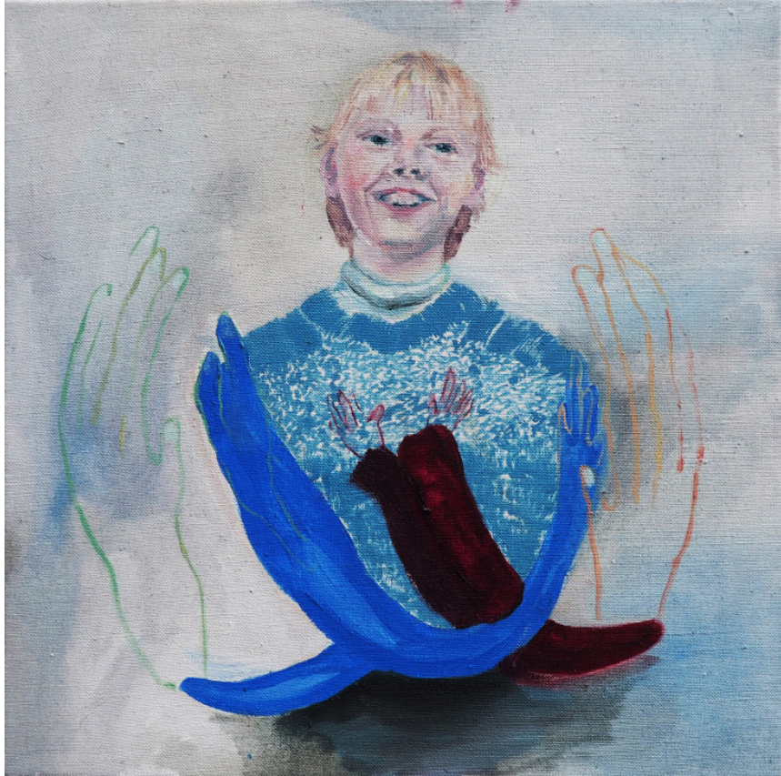
Sebeláska, olejomalba, plátno, 40 x 40 cm, 2019 Selflove, oil painting, canvas, 40 x 40 cm, 2019