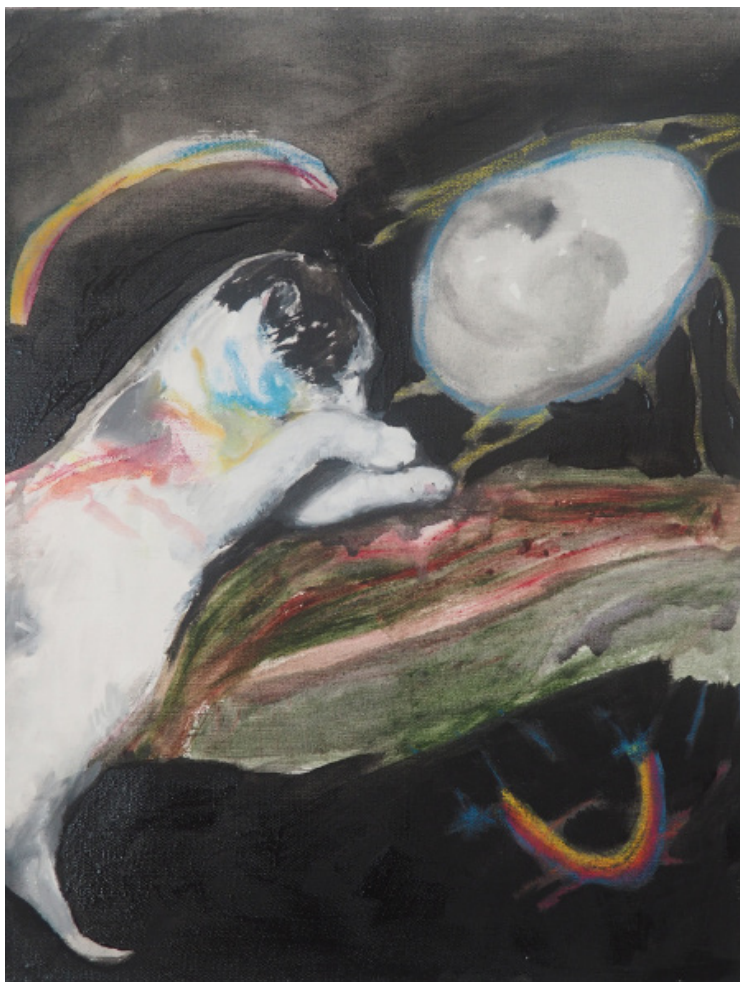
(ne) Na asfaltu, akryl, plátno, 35 x 45 cm, 2019 (Not) On asphalt, acrylic, canvas, 35 x 45 cm, 2019