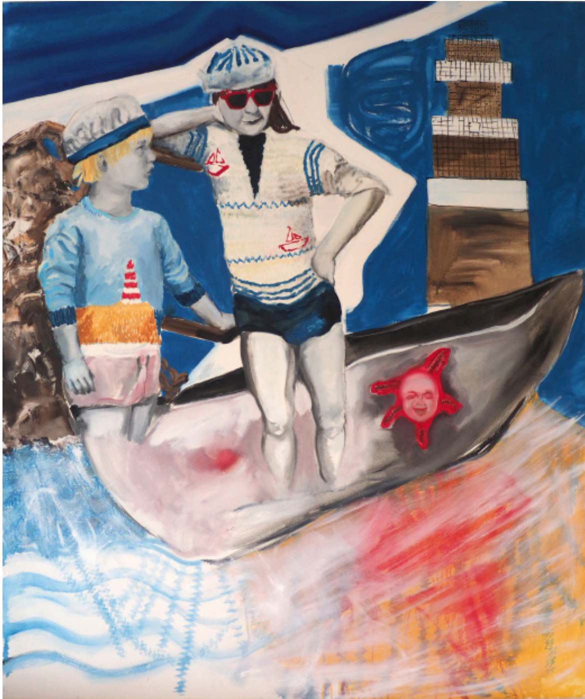
Mořobijci, olej, plátno, 110 x 130 cm, 2019 Seafighters, oil on canvas, 110x130 cm, 2019