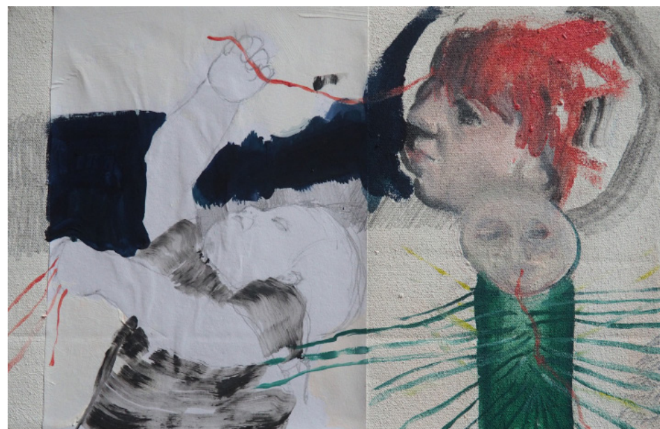
Házíš, kombinovaná technika, plátno, 20 x 30 cm, 2019 You throw, mixed media, canvas, 20 x 30 cm, 2019