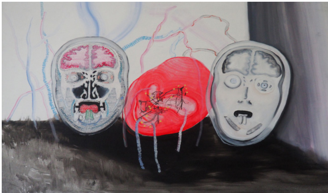
Frontální pletený řez hlavou, olejomalba, 65x95 cm, 2019 Frontal knitted head cut, olejomalba, 65x95 cm, 2019