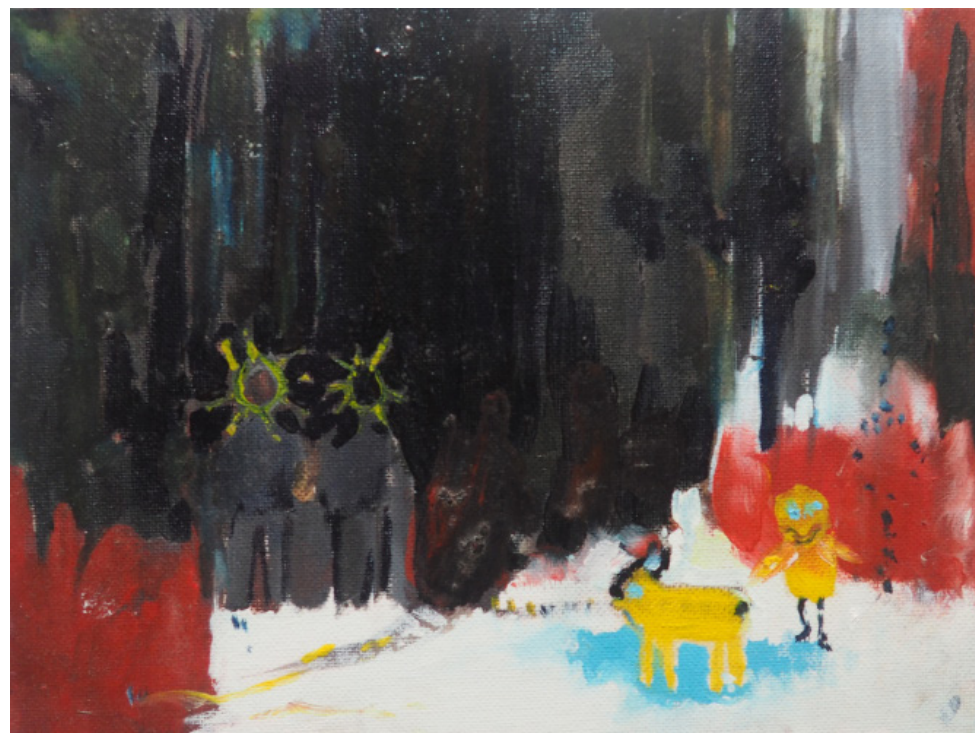
Na procházce , olej, sololit, 15 x 25 cm, 2018 On a walk, oil painting, fibreboard, 15 x 25 cm, 2018