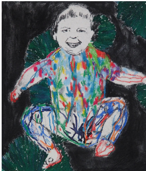
Temné vody, 35 x 30 m, kombinovaná technika, 2020 Dark waters, 35 x 30 cm, mixed media, 2020