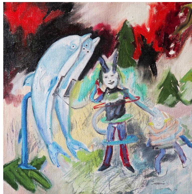
Volání lásky, olej na plátně, 35x35 cm , 2020 Calling Love, oil on canvas, 35 x 35 cm, 2020