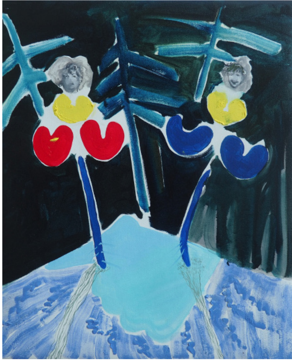
Lesní květy, olej na plátně, 55 x 45 cm, 2020 Forest flowers, oil on canvas, 55 x 45 cm, 2020