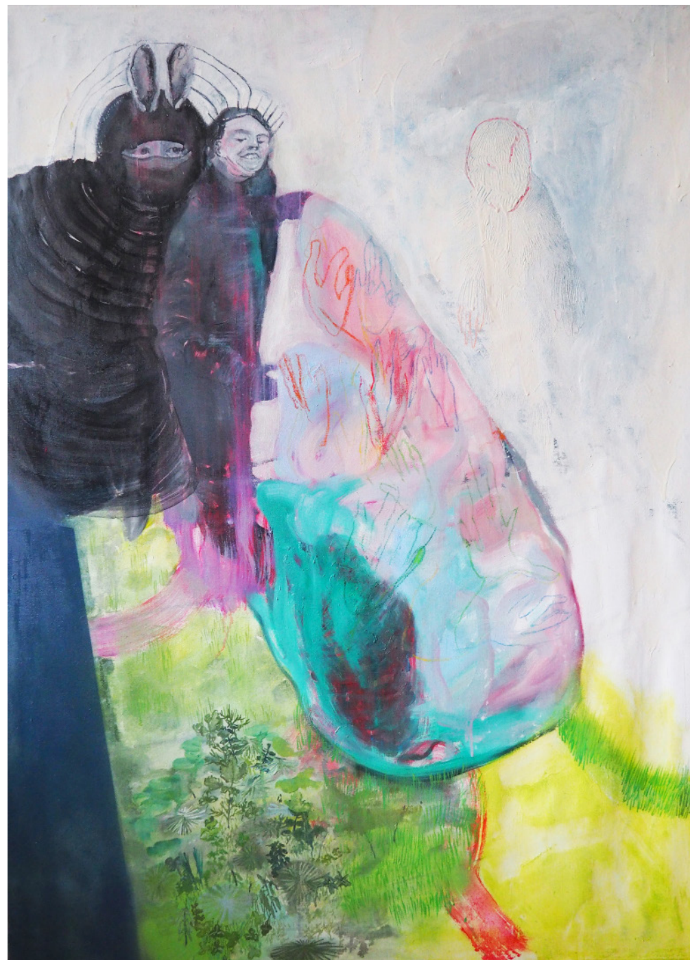
Přátelé kultu Kůže, 110 x 80 cm, mixed media, 2020 Friends of the cult Skin, 110 x 80 cm, mixed media, 2020