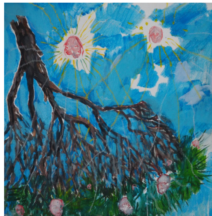
Hlavy akácie, kombinovaná technika, 25 x 25 cm, 2020 Heads of Acacia, mixed media, 25 x 25 cm, 2020