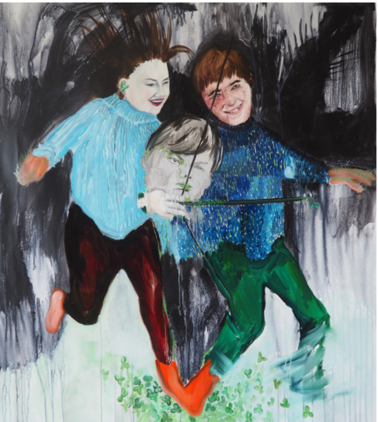
Honění se za štěstím (To jediné řešení), kombinovaná technika, 90 x 100 cm, 2020 Fast chasing after Luck (The only solution), 100 x 90 cm, mixed media, 2020