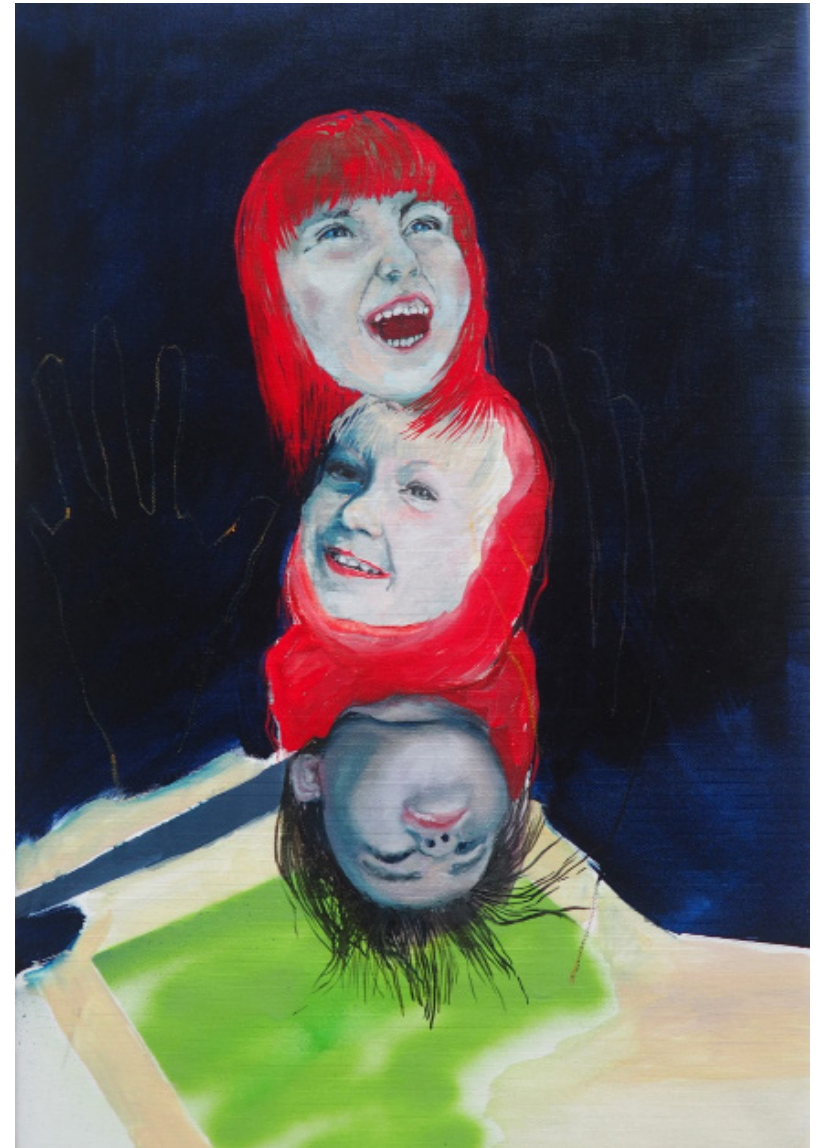
Aequalitatem, olejomalba, 60 x 40 cm, 2019 Aequalitatem, oil painting on canvas, 60 x 40 cm, 2019