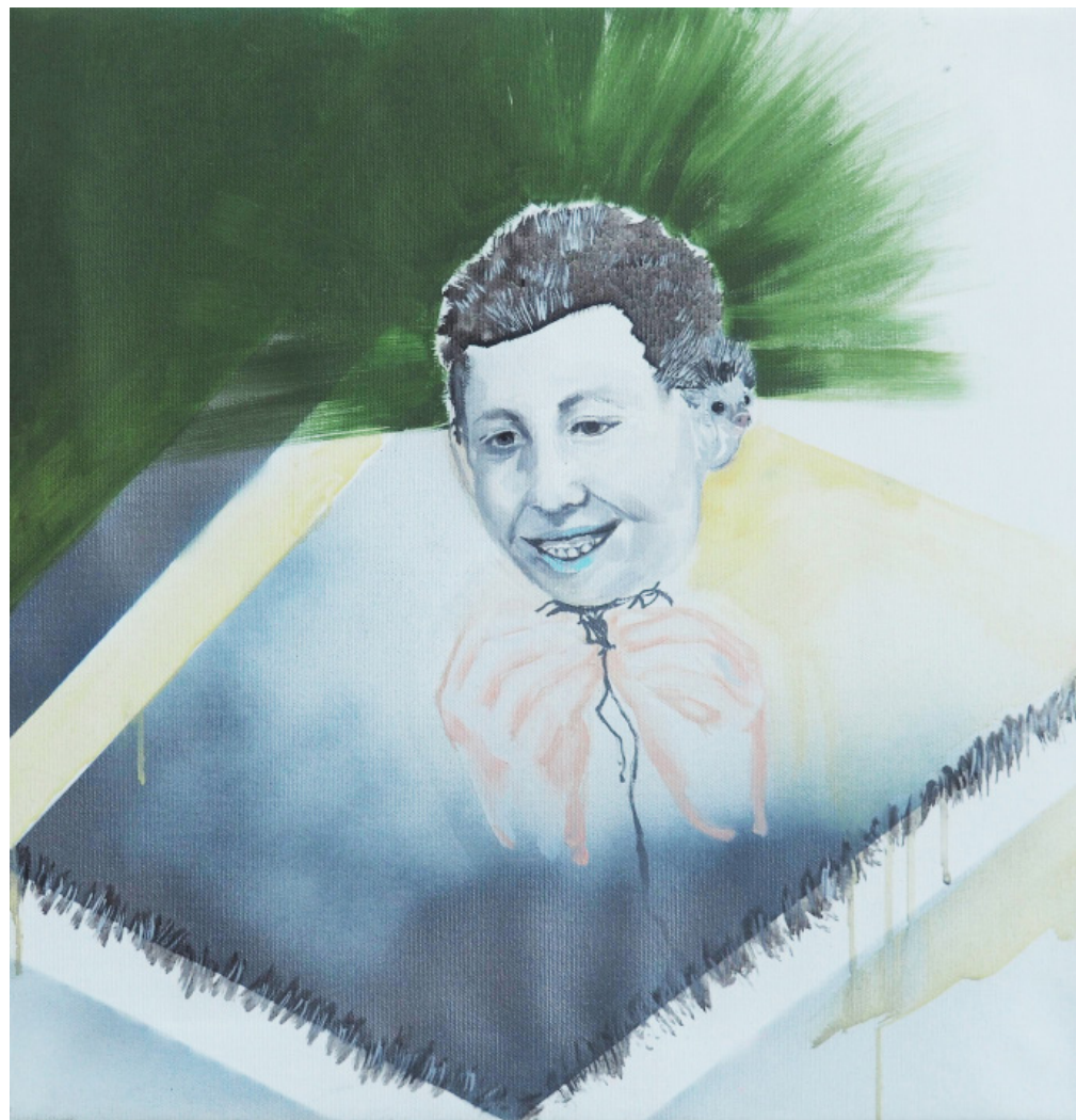
Pichlavá identita, olej na plátně, 45 x 45 cm, 2020 Prickly identity, oil on canvas, 45 x 45 cm, 2020