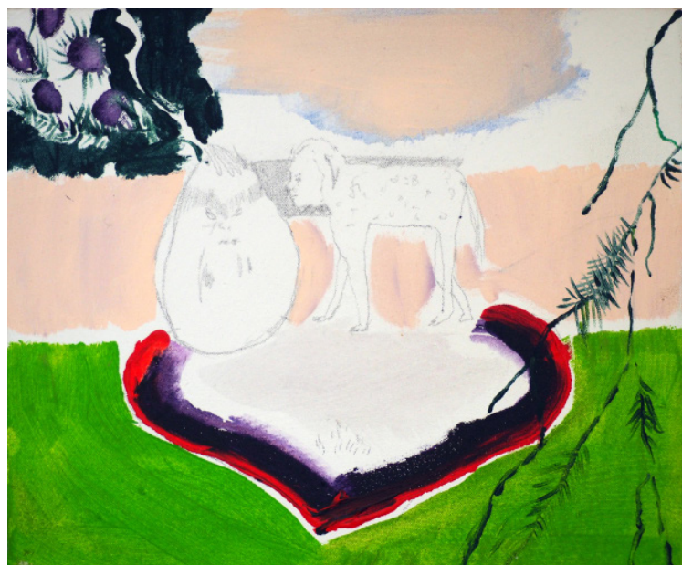
Sbírání švestek z jedle, akryl, plátno, 25 x 30 cm, 2019 Picking up plums from a fir, acrylic on canvas, 25 x 30 cm, 2019