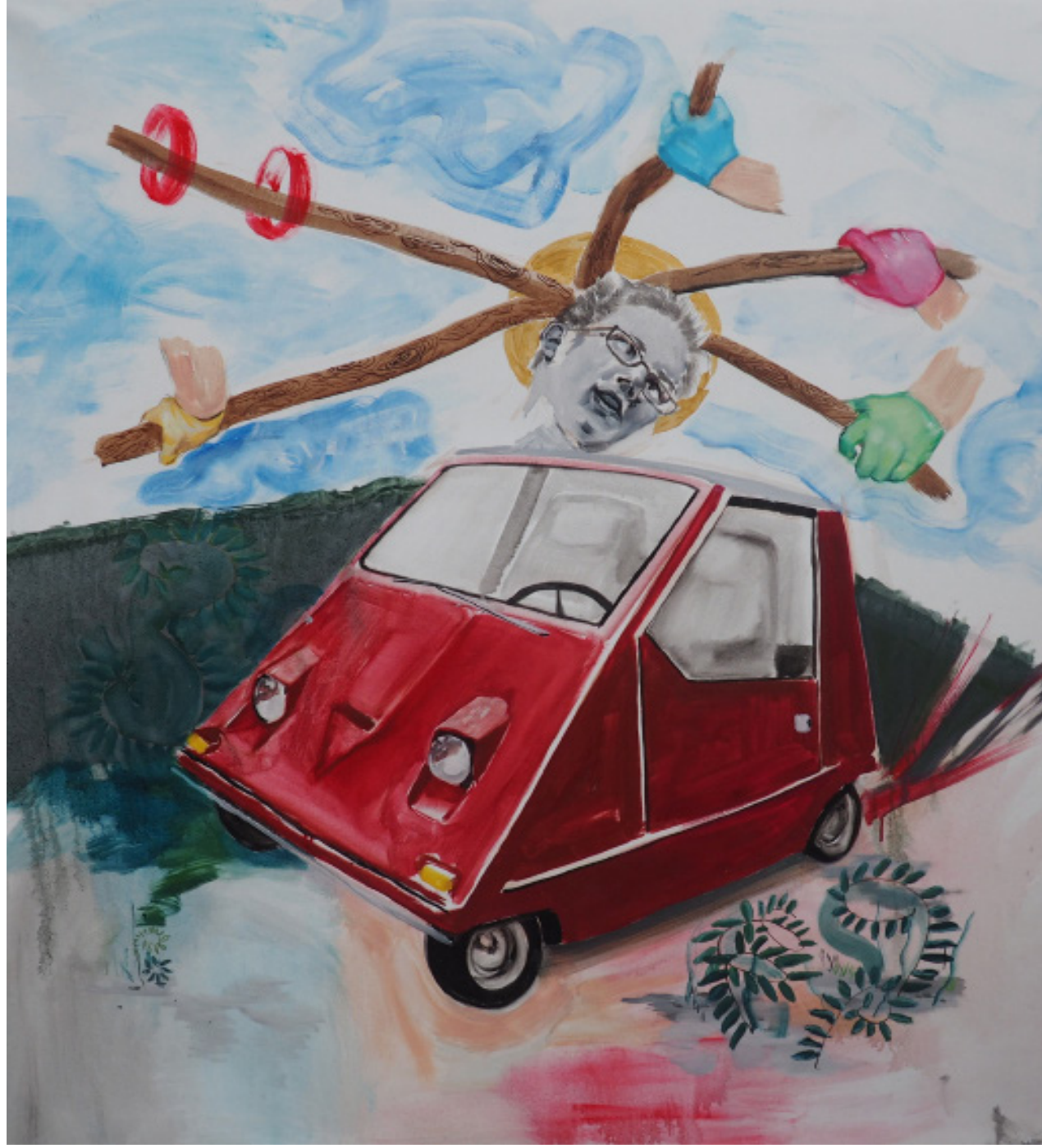
orunování trnovou korunou, kombinovaná technika, 100 x 115 cm, 2019 Crown of thorns, mixed media, 100 x 115 cm, 2019