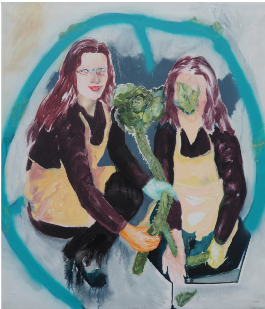
Holky Hlávky, kombinovaná technika, plátno, 80 x 100 cm, 2019 Hlávky's girls, mixed media, canvas, 80 x 100 cm, 2019