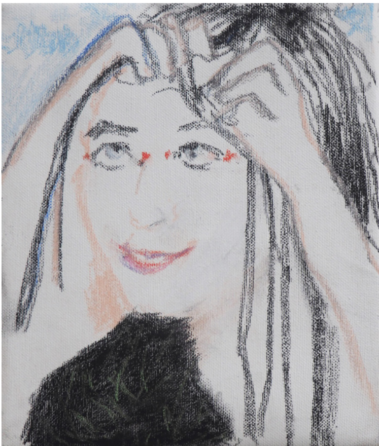
Líza si zaplétá, pastel, plátno, 20 x 24 cm, 2019 Lisa braids hair, pastel, canvas, 20 x 24 cm, 2019