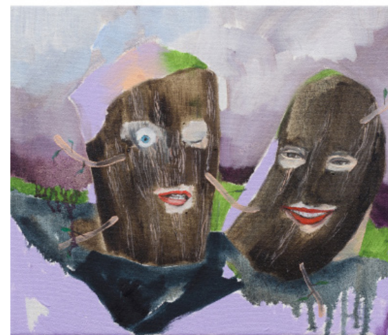
Přátelé, 25 x 30 cm, olej na plátně, 2020 Friends, 25 x 30 cm, oil on canvas, 2020