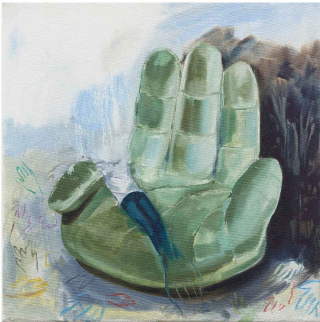
Asimilace, 50 x 50 cm, olej na plátně, 2020 Assimilation, 50 x 50 cm, oil on canvas, 2020