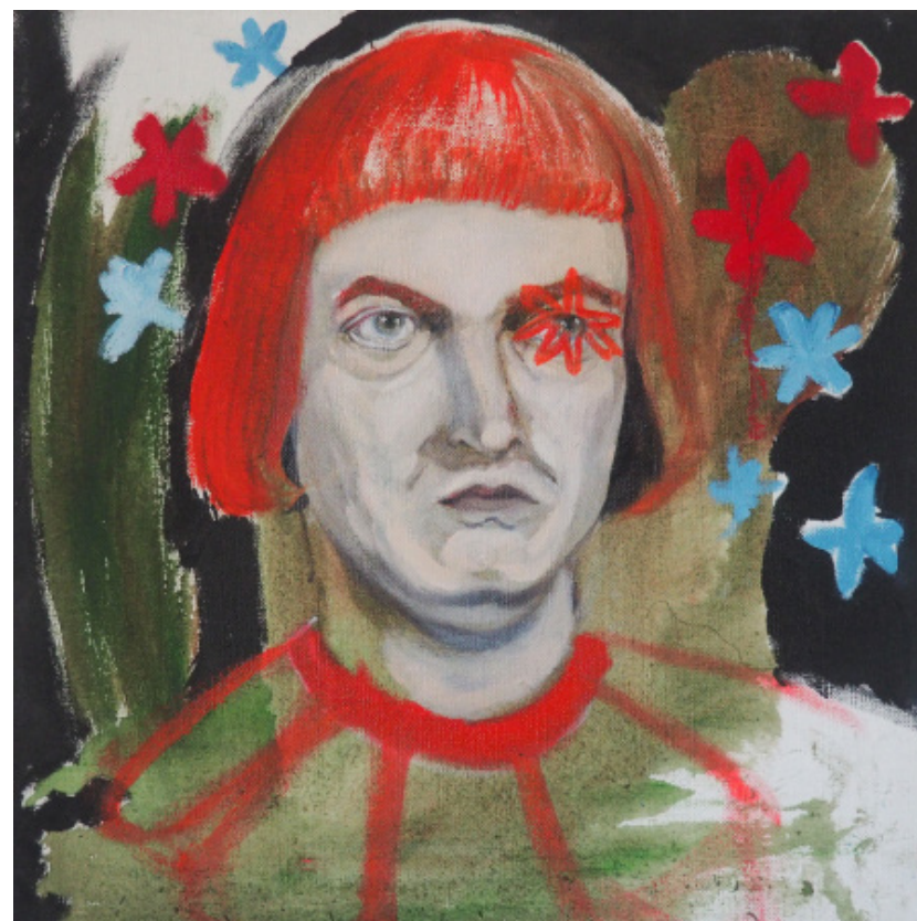
Kazisvět, olejomalba, plátno, 40 x 40 cm, 2019 Kazisvět, oil painting on canvas, 40 x 40 cm, 2019