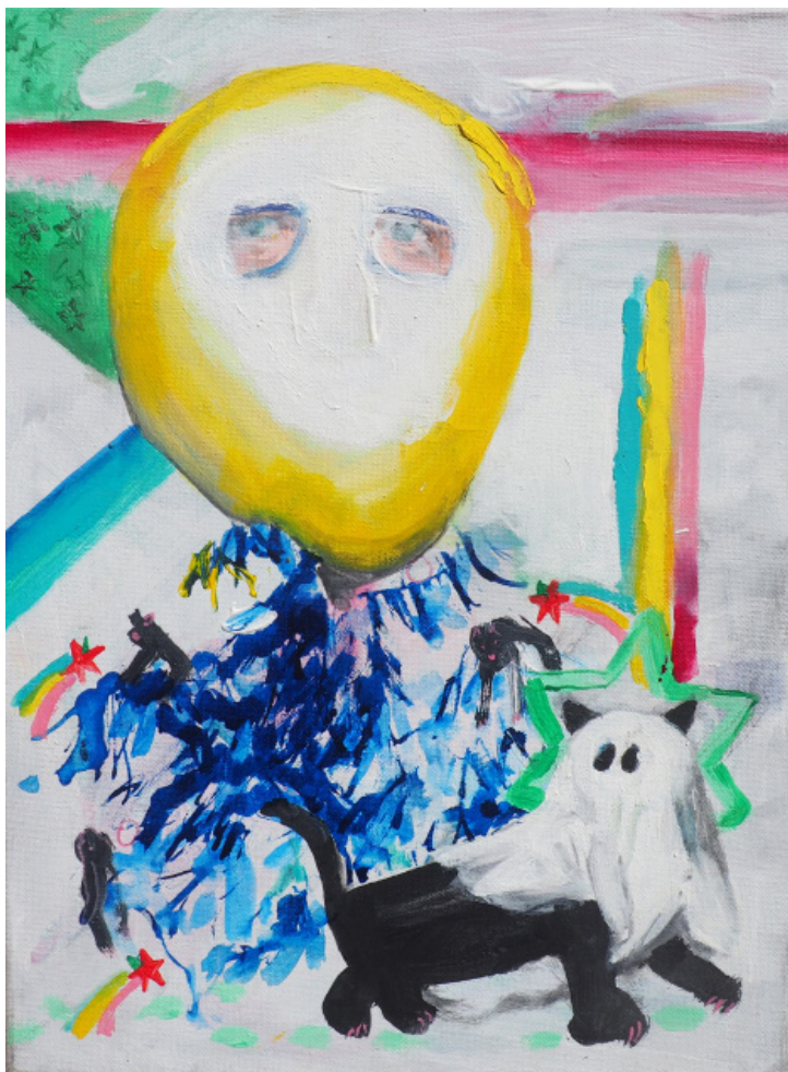
Chlap jako vánoční koule, akryl, plátno, 30 x 40 cm, 2019 Man as Christmas ball, acrylic on canvas, 30 x 40 cm, 2019