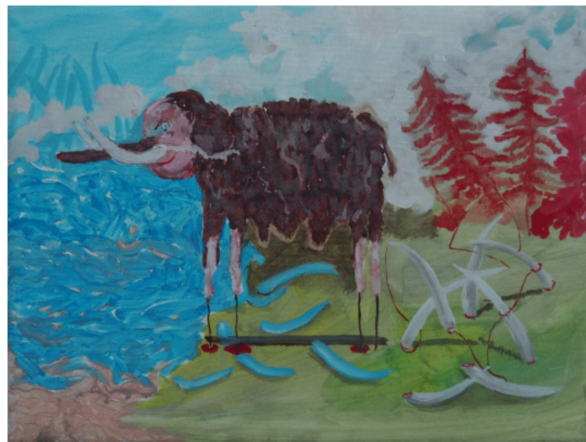
Sen bez názvu, akryl, plátno, 30 x 40 cm, 2020 Dream without title, acrylics on canvas, 30 x 40 cm, 2020