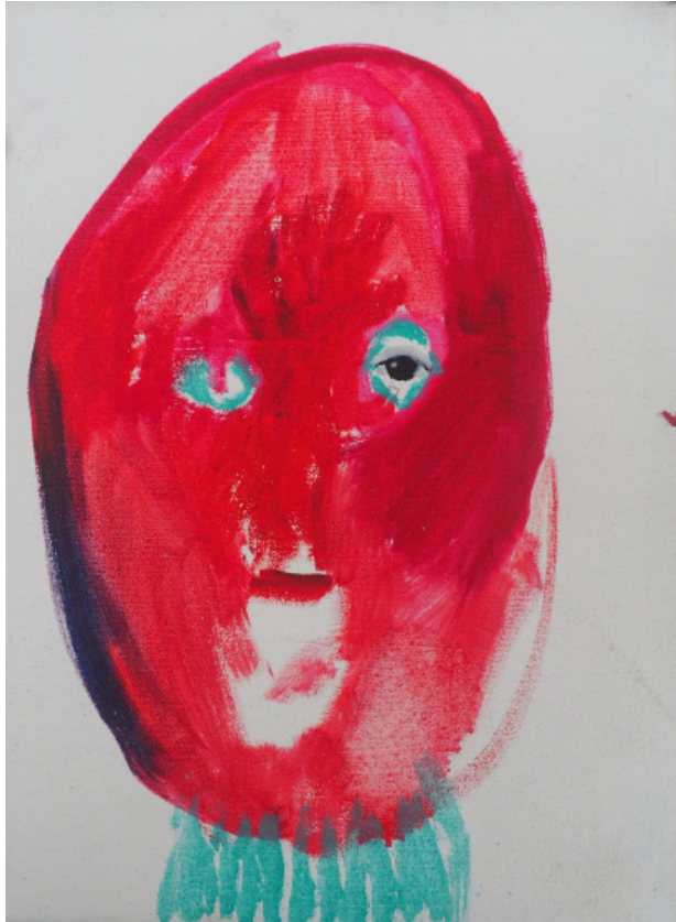
Hlava č. 45, olejomalba, 30x25 cm, 2019 Head 45., oil, 30x25 cm, 2019