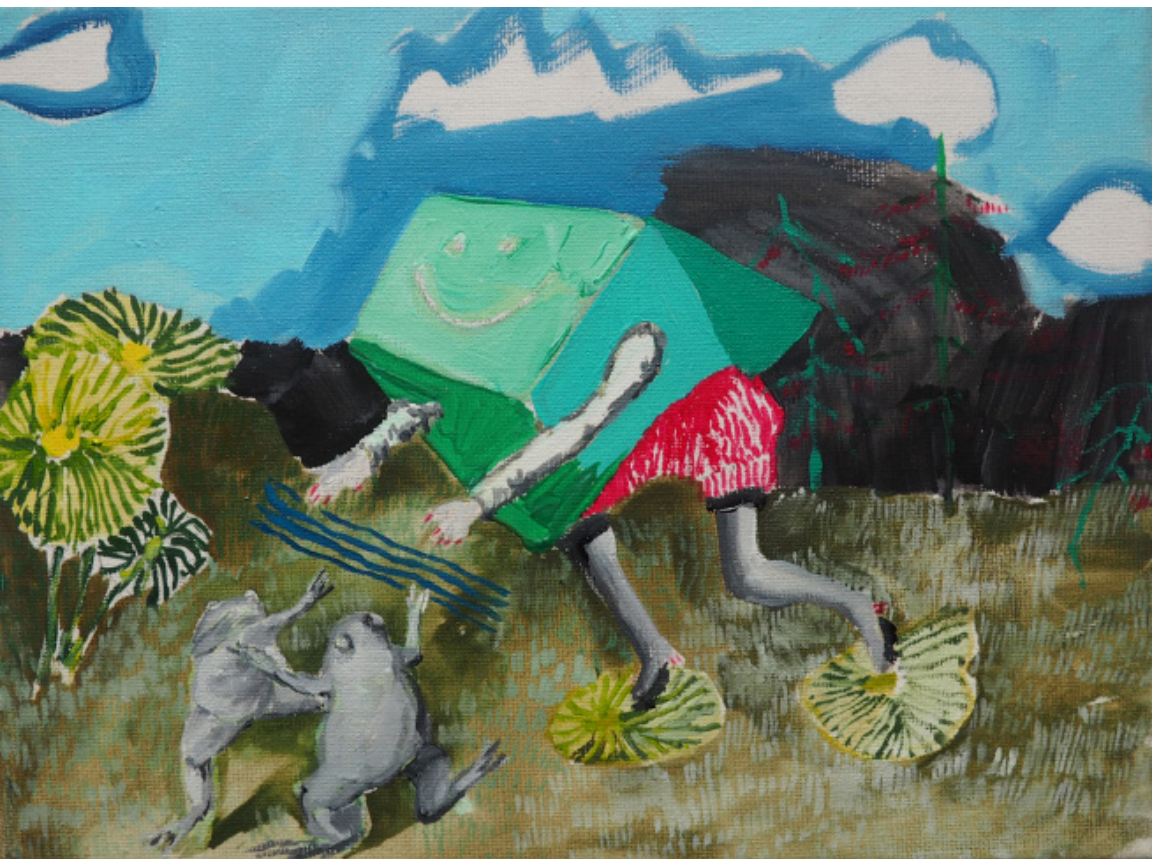
Síla Ieknínú, akryl na plátně, 15 x 20 cm, 2019