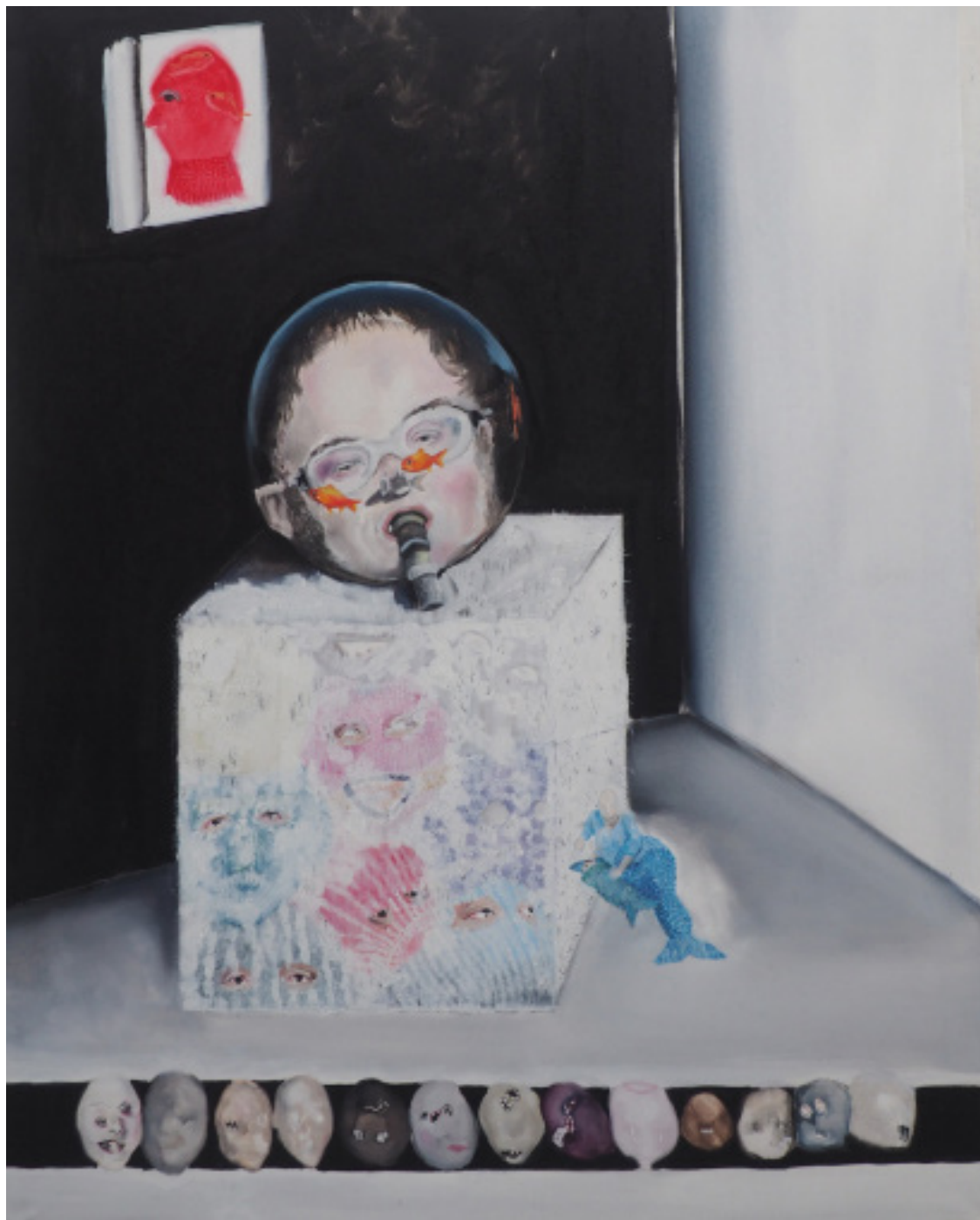
The man, olejomalba, 130x110cm, 2019 The man, oil, 130x110cm, 2019