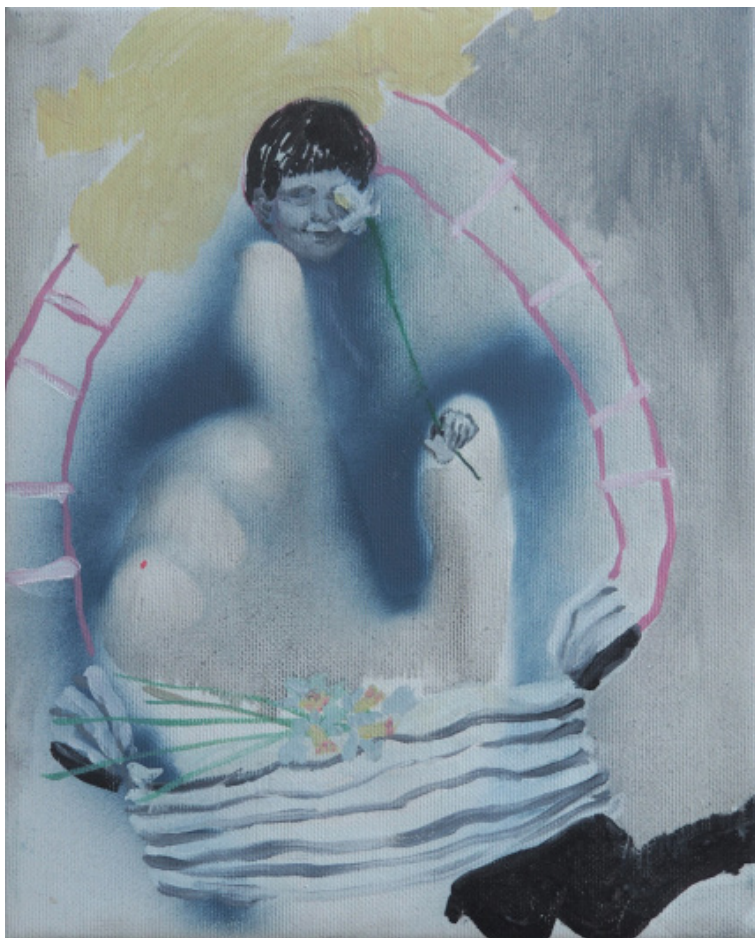
Narcis, olej na plátně, 25 x 20 cm, 2020 Narcis, oil on canvas, 25 x 20 cm, 2020