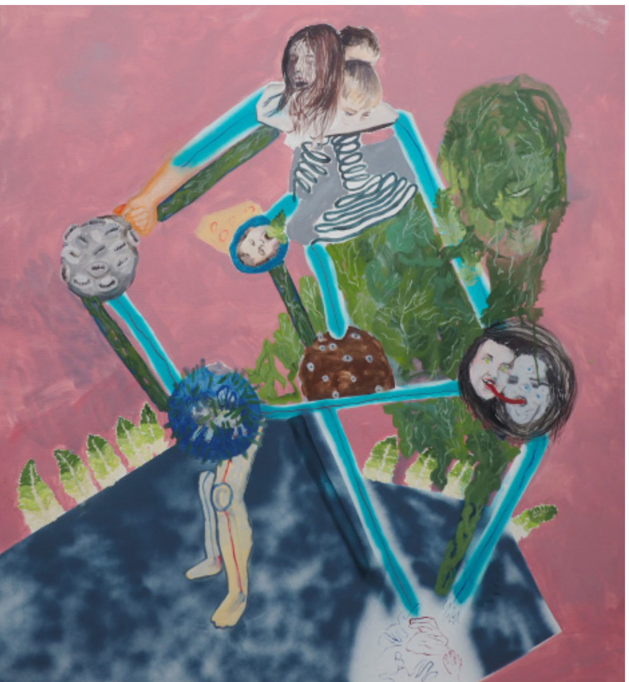
Ideální tělesná konstrukce, kombinovaná technika, 115 x 105 cm, 2020 Ideal body construct, mixed media, 115 x 105 cm, 2020