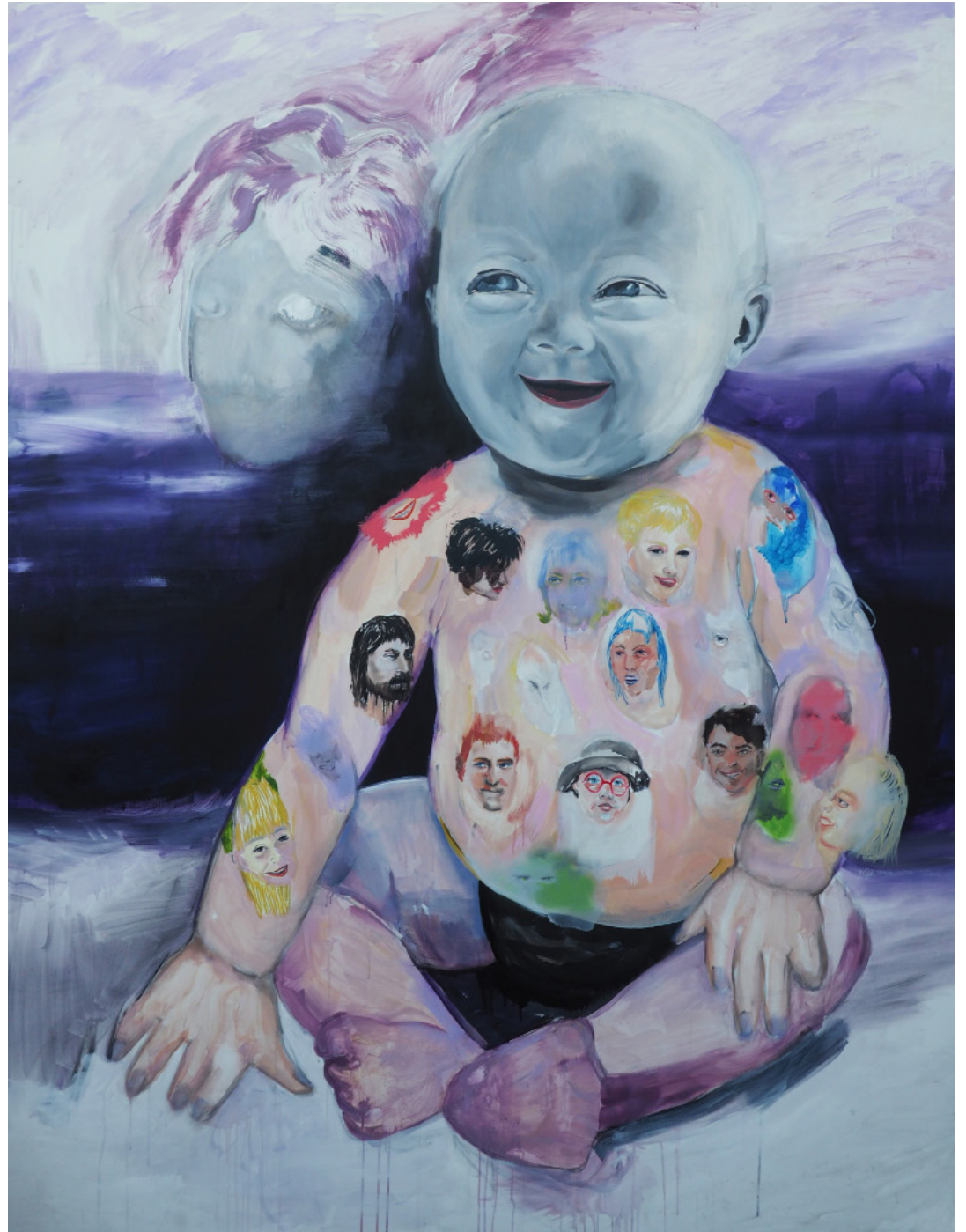
Kožní problémy, kombinovaná technika 210 x 160 cm, 2020 Skin problems, mixed media, 210 x 160 cm, 2020