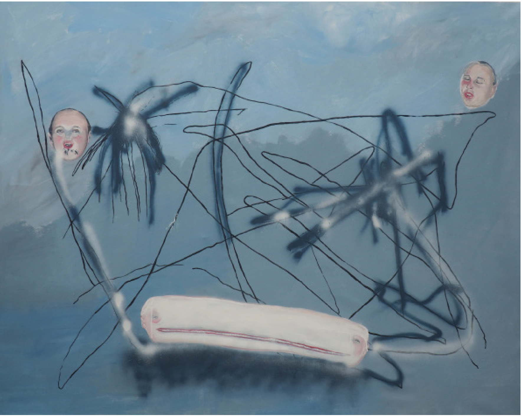
Linky v podvědomí, kombinovaná technika, plátno, 169x199 cm, 2020 Lines in the subconscious, mixed media on canvas, 169x199 cm, 2020