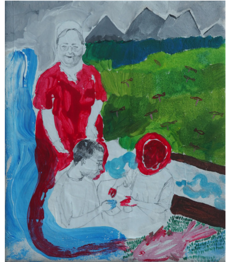
Jiná možnost, kombinovaná technika, 24 x 20 cm, 2020 Other option, mixed media, 24 x 20 cm, 2020