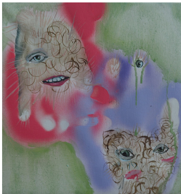
Ručičky, kombinovaná technika, 24 x 25 cm, 2020 Little hands, mixed media, 24 x 25 cm, 2020