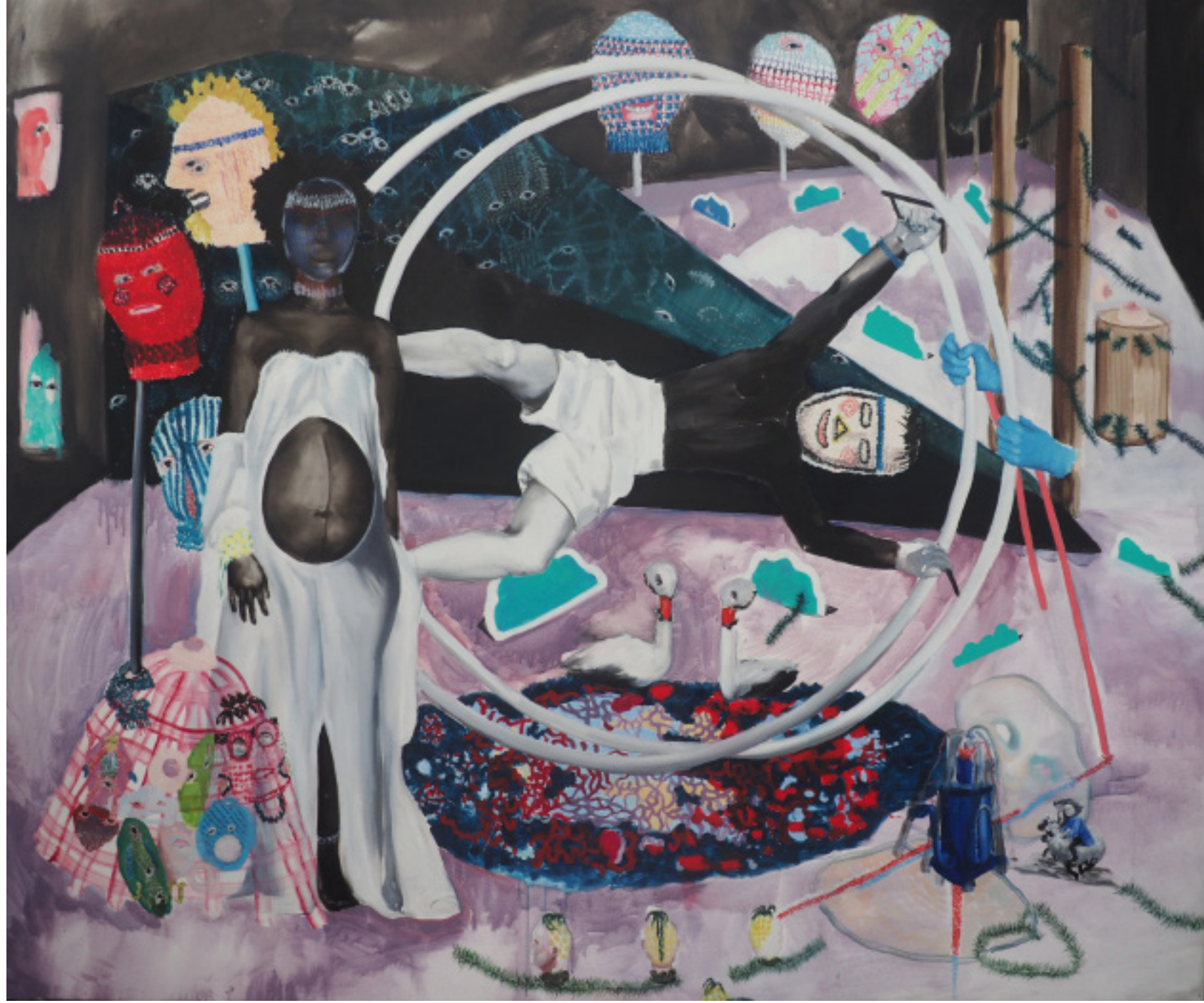
Stagnující pohyb, kombinovaná technika, 190x160cm, 2019 Movement of stagnation, mixed media, 190x160cm, 2019