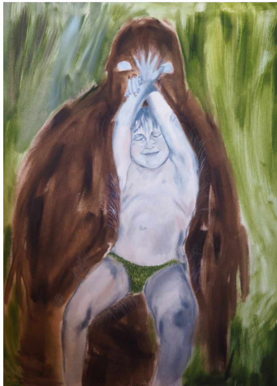
Wilderman, olej na plátně, 65 x 95 cm, 2020 Wilderman, oil on canvas, 65 x 95 cm, 2020