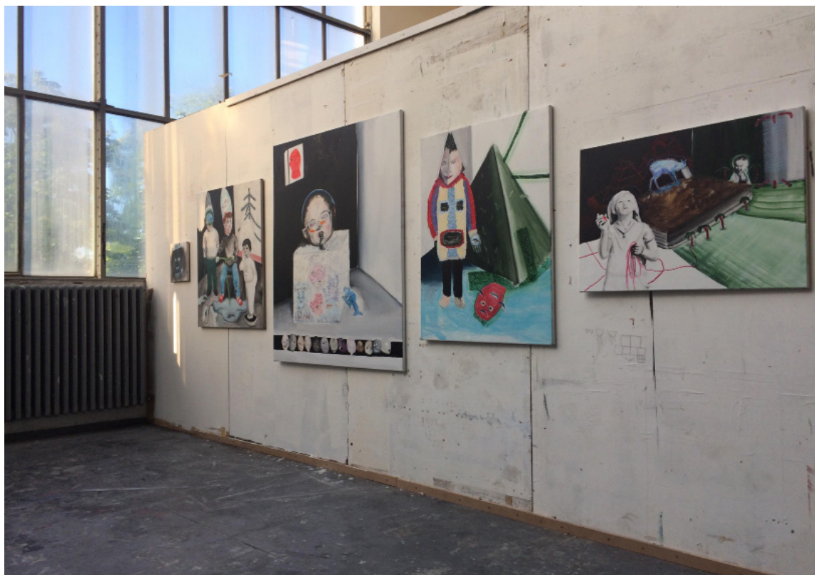
Pohled na jednu stěnu letních klauzur na AVU, 2019 View on one side of summer semestral works exhibition at AVU, 2019