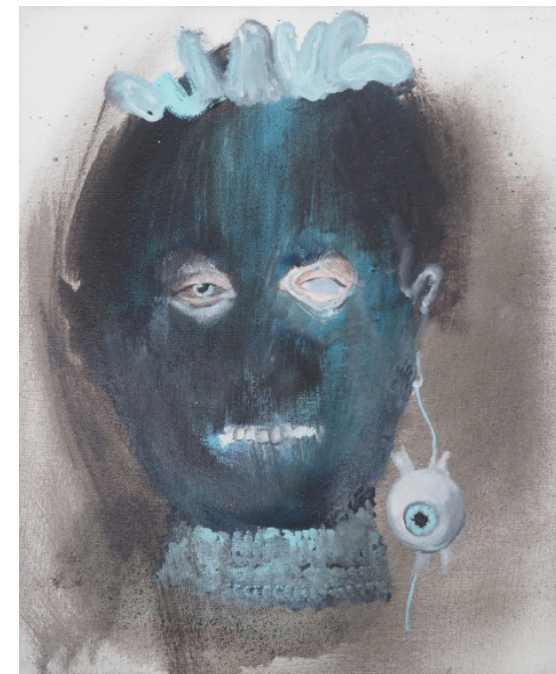
Hlava č.2, olejomalba, 30x25 cm, 2019 Head 2., oil, 30x25 cm, 2019