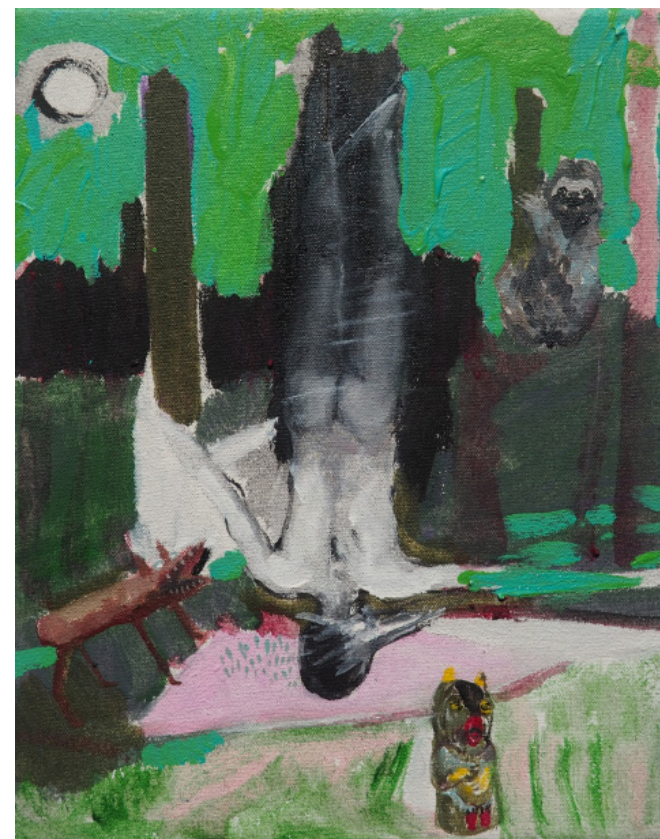
Thank you, olejomalba, 15 x 20 cm, 2019 Thank you, oil on canvas, 15 x 20 cm, 2019