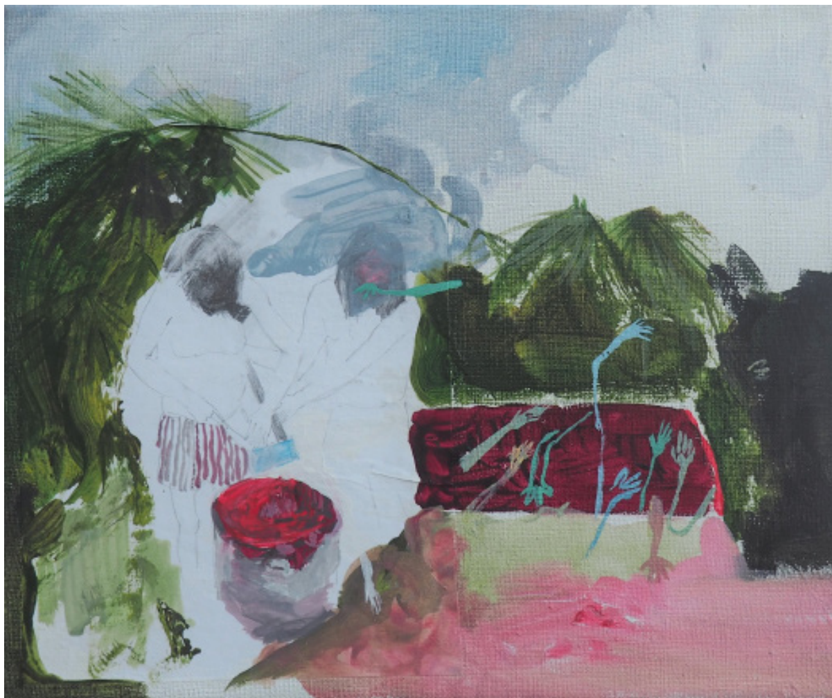
Mýcení, kombinovaná technika, 25 x 30 cm, 2020 Clearance, mixed media, 25 x 30 cm, 2020