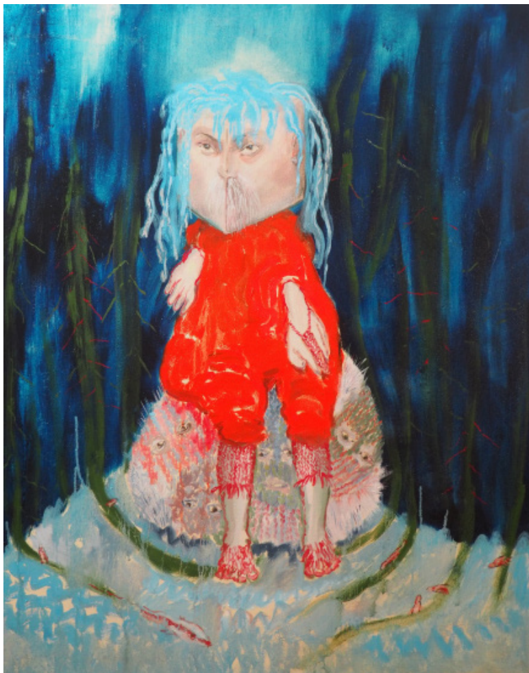
Spodní prádlo podzemní vody, olej na plátně, 95x65 cm, 2020 Underwear of groundwater, oil on canvas, 95x65 cm, 2020