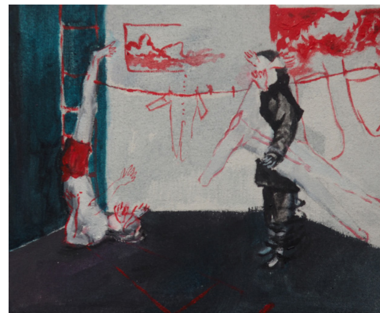
Prádlo , olejomalba, 20 x 25 cm, 2019 Laundry, oil painting on canvas, 20 x 25 cm, 2019