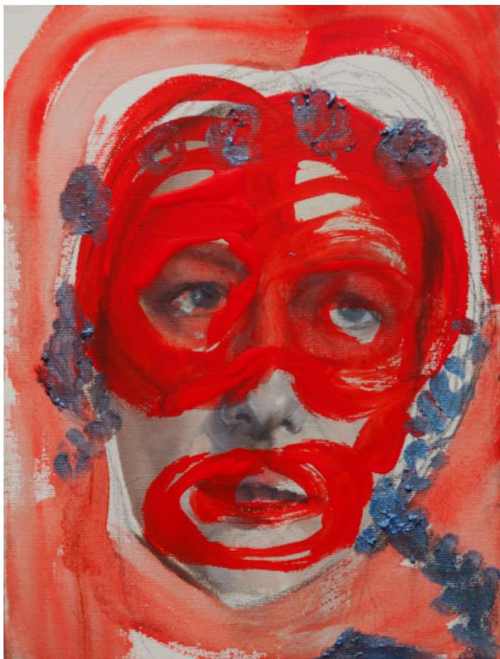
Sv. Helena, olejomalba, plátno, 25 x 15 cm, 2019 St. Helene, oil painting on canvas, 25 x 15 cm, 2019