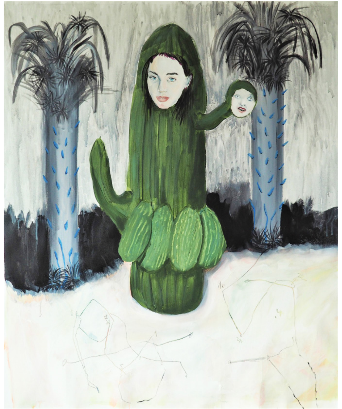
Trnité hádanky identity, kombinovaná technika , 107 x 91 cm, 2020 Thorny identity puzzles, mixed media on canvas, 107 x 91 cm, 2020