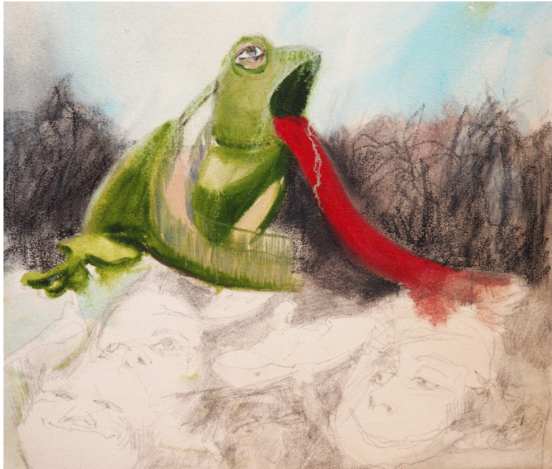
Všechno neřčené, 30 x 35 cm, kombinovaná technika, 2020 All the unsaid, 30 x 35 cm, mixed media, 2020