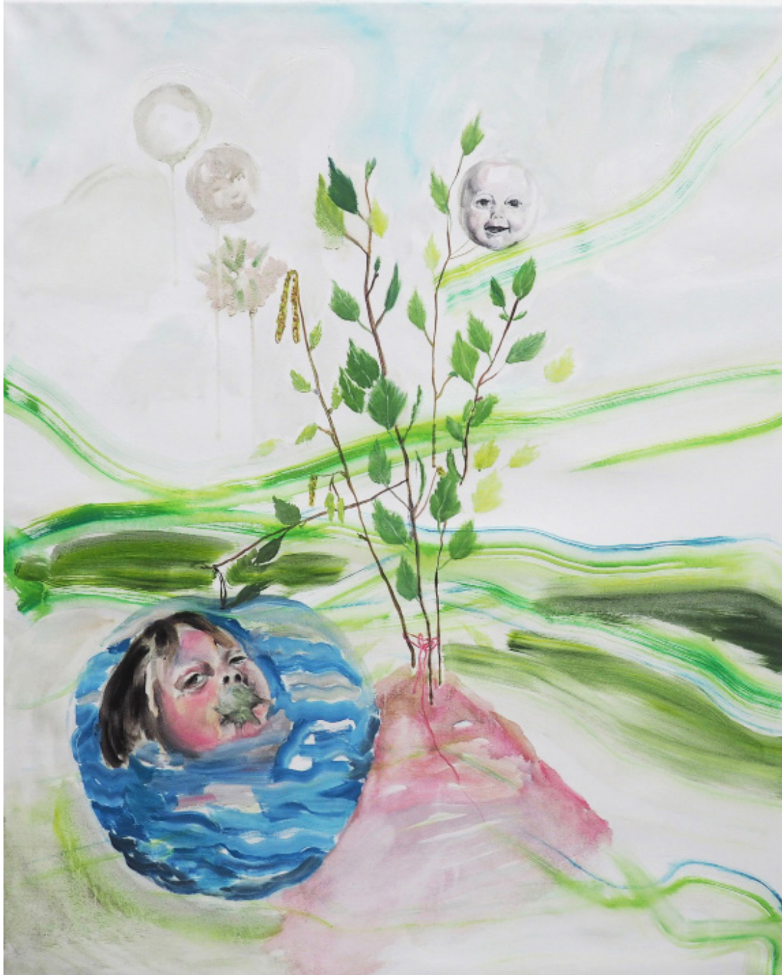
Jablko z břízy, olejomalba, plátno, 90 x 110 cm, 2019 Apple from a birch, oil painting, 90 x 110 cm, 2019