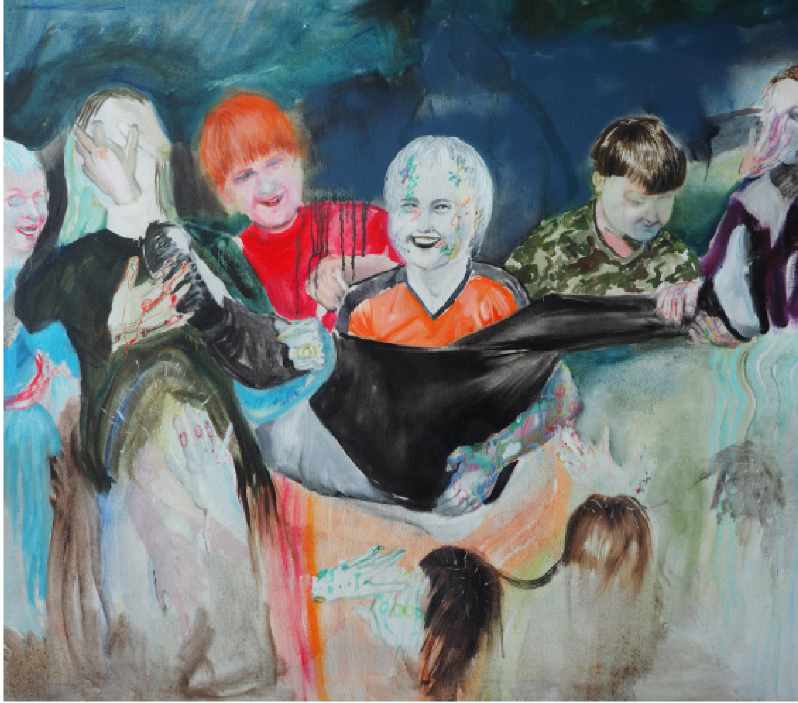
Team job, kombinovaná technika, plátno, 110x125 cm, 2019 Team job, mixed media on canvas, 110x125 cm, 2019