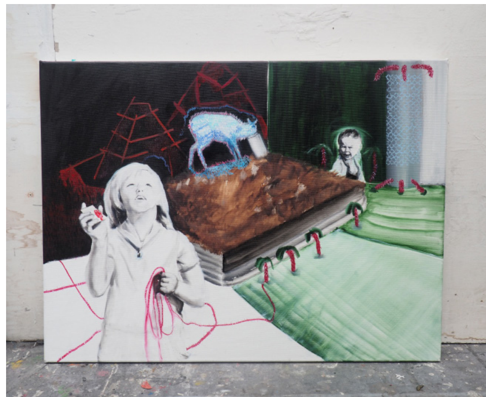
Přírodní mimikry jsou všudypřítomné, olejomalba, 50x90 cm, 2019 Natural mimicry is ubiquitous, oil, 50x90cm, 2019