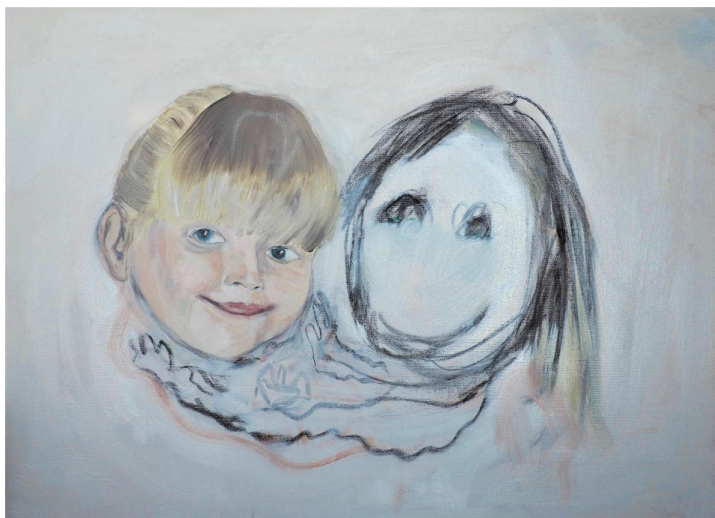
Přátelé, 50 x 70 cm, kombinovaná technika, 2020 Friends, 50 x 70 cm, mixed media, 2020