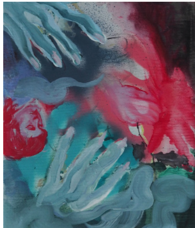
Tvoje ruce, kombinovaná technika, 25 x 30 cm, 2020 Your hands, mixed media, 25 x 30 cm, 2020