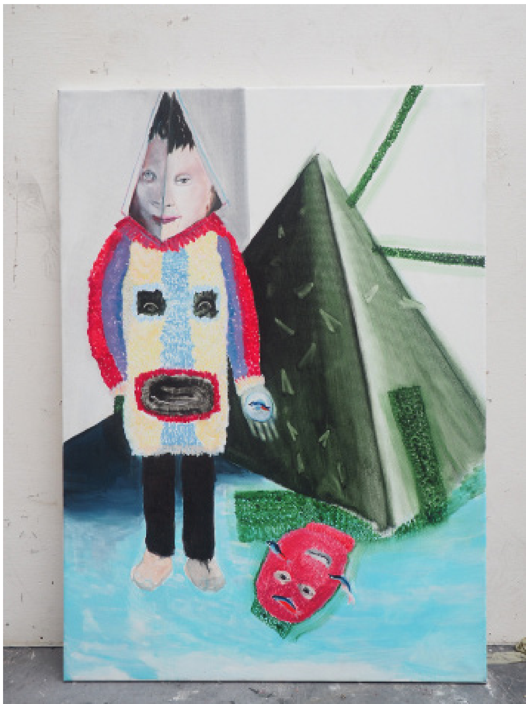
Jiná vodní možnost, olej, 120x80 cm, 2019 Another aqua possibility, oil, 120x80 cm, 2019