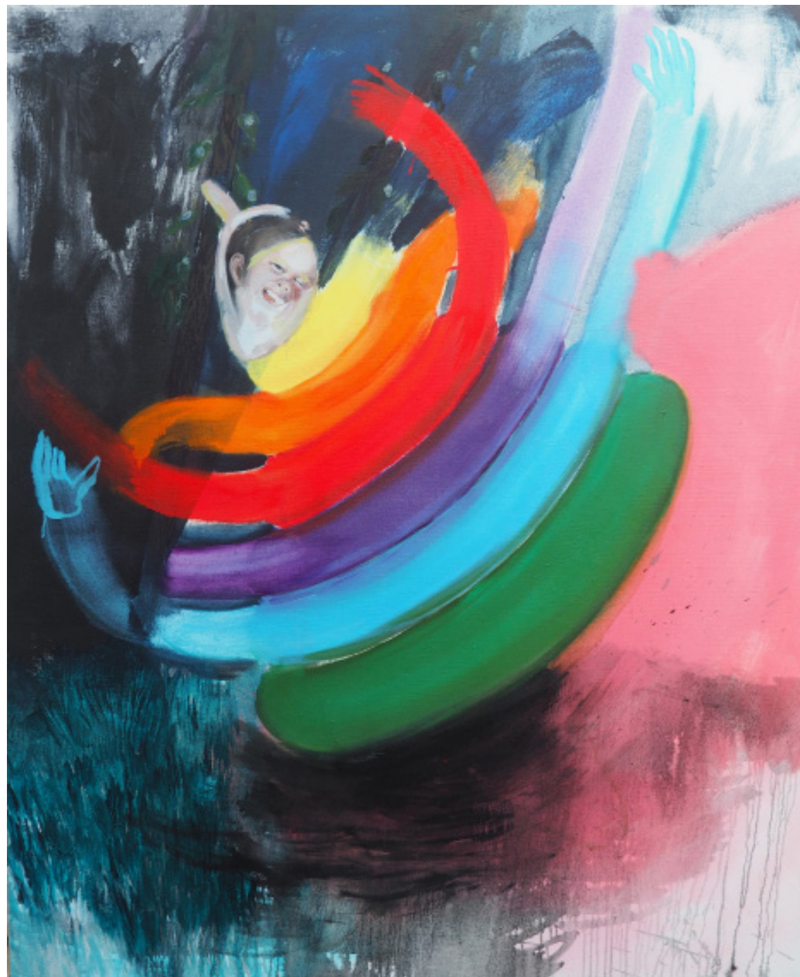
Pohyb v hloubce, kombinovaná technika, 145 x 120 cm, 2020 Movement in depth, mixed media, 145 x 120 cm, 2020