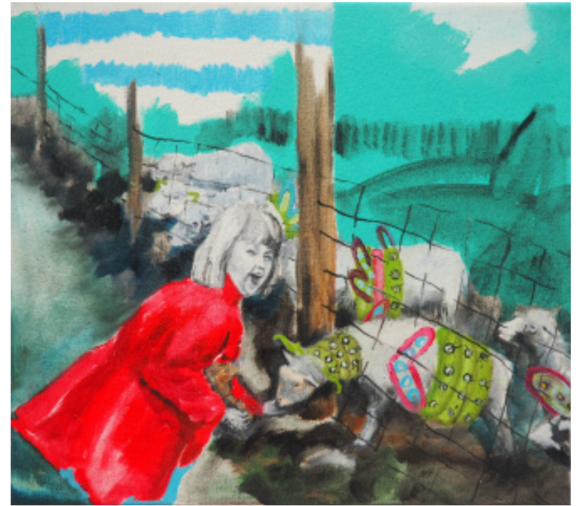
Krmící holka, olejomalba, 45x40 cm, 2019 The Feeding girl, oil on canvas, 45x40 cm, 2019