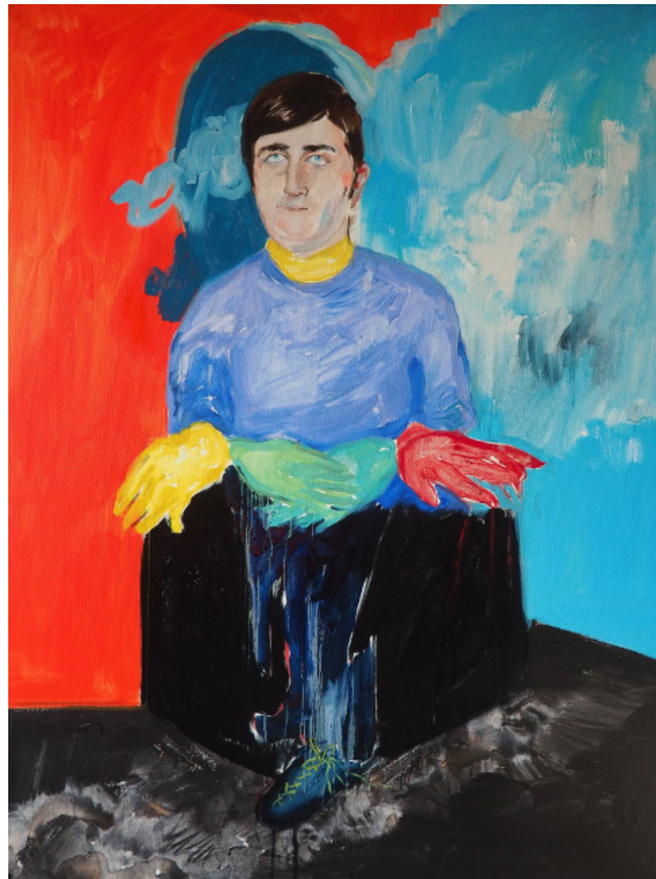
Skutečný trik, kombinovaná technika, 80 x 60 cm, 2020 Real Trick, mixed media, 80 x 60 cm, 2020