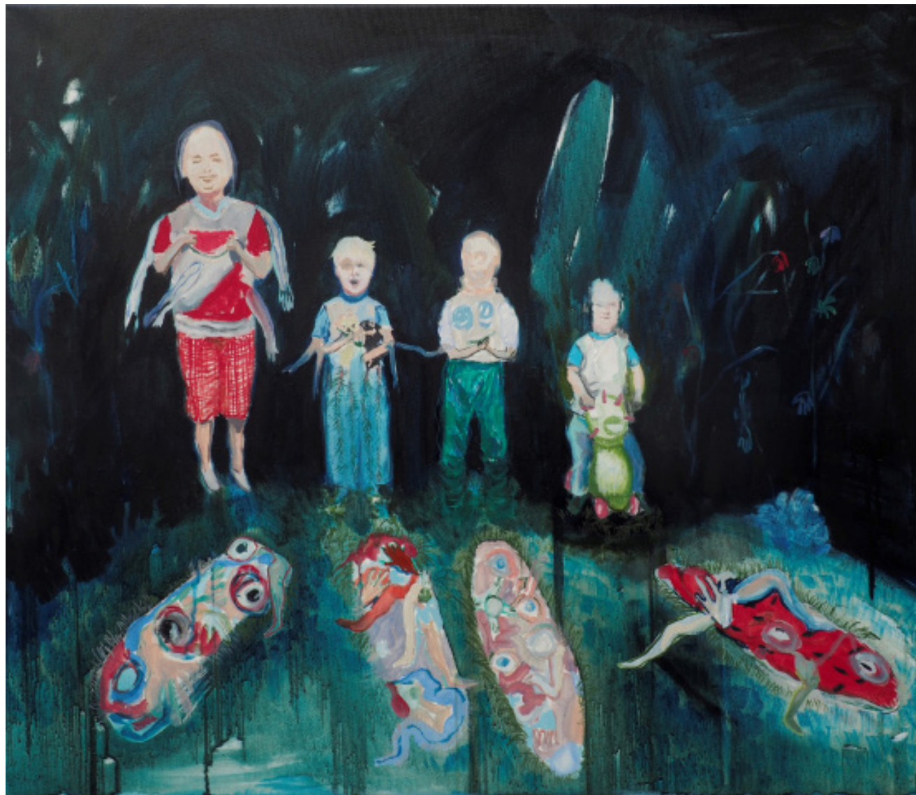
Malé pohyby zla, olej na plátně, 60 x 70 cm, 2020