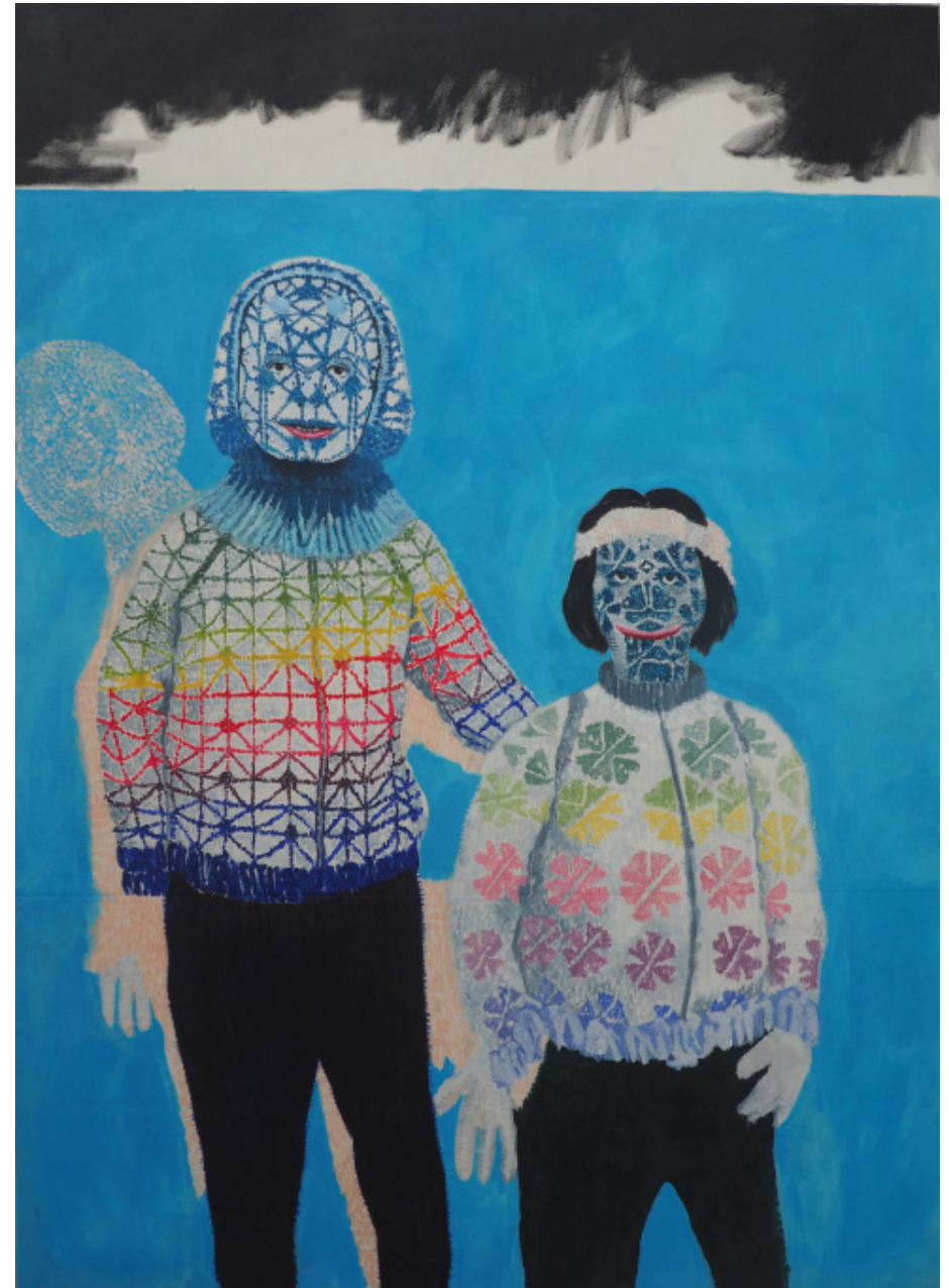
Harmonie, olejomalba, 160x90 cm, 2019

Borders of possibilities of (knitted) masks are a platform for a relation, where applies projection on the surface of body and projection of surface on another surface. Values of backdrop and reality are again pulverized and it is only up to a individual spectator's recognition where he finds borders, how many entries, contacts and even surface projections are needed for dissolution identity.